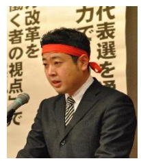
津田沼支部 永久書記長