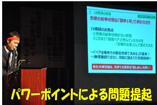
パワーポイントによる問題提起