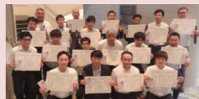
情報コンクールの受賞機関の皆さん 地本特別推薦賞 千葉運輸区分会 おめでとうございます!