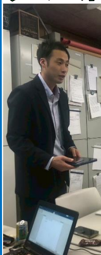
本部青年連絡協議会 七ツ田副議長