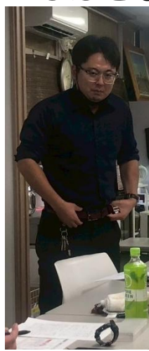
八王子地方本部 神宮寺組織担当部長